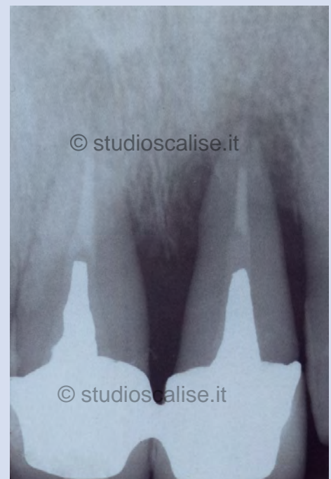
Fig.2. Radiografia endorale prima del trattamento.