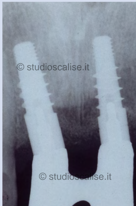
Fig. 9 . Radiografia endorale durante la prova della struttura metallica.