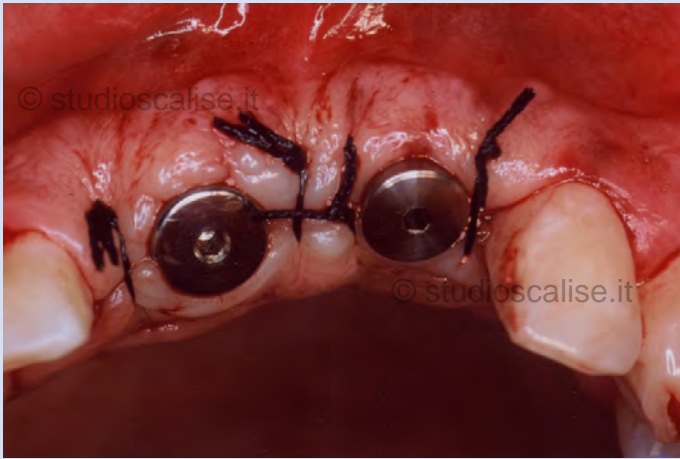
Fig. 4. Sutura del lembo attorno ai pilastri di guarigione.