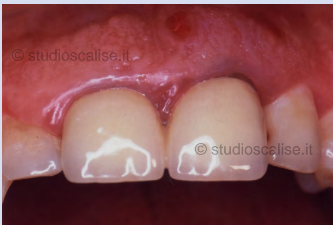
Fig.1. Aspetto endorale prima del trattamento riabilitativo.

La compromissione parodontale degli elementi richiede la loro avulsione e la sostituzione mediante impianti dentali.