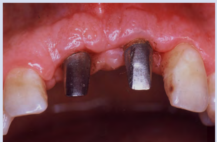
Fig. 7. Applicazione dei monconi protesici .