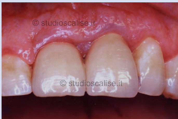
Fig. 10. Aspetto endorale dopo la cementazione delle corone in metallo-ceramica.