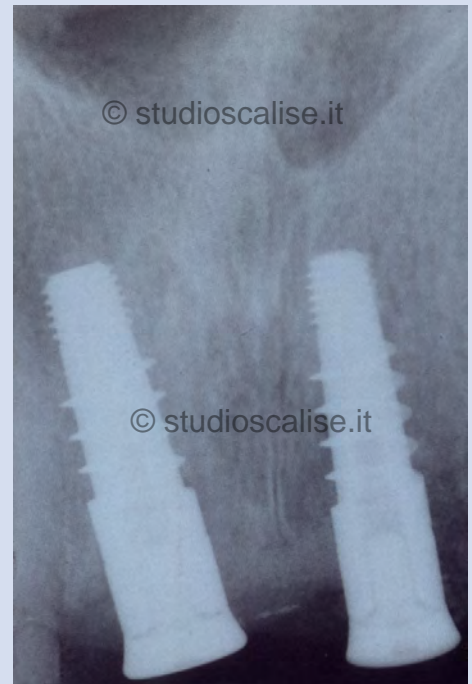
Fig. 5. Radiografia endorale dopo il posizionamento degli impianti.