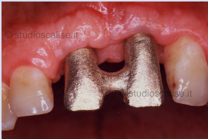
Fig. 8. Prova della struttura metallica