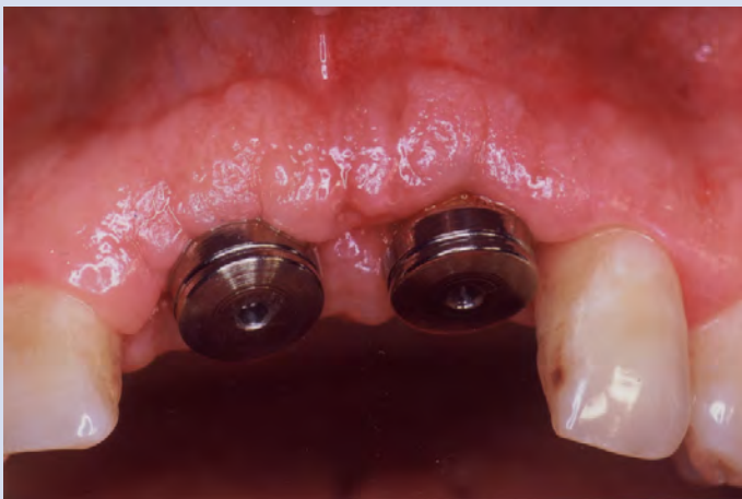
Fig. 6. Aspetto endorale dopo la guarigione gengivale e la sostituzione dei pilastri di guarigione