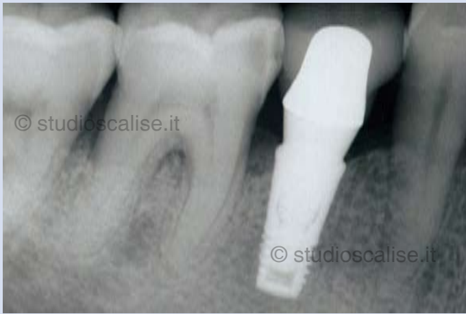
Fig. 8. Controllo radiografico a 5 anni dal posizionamento dell'implanto. Perfetto mantenimento dell'osso marginale.