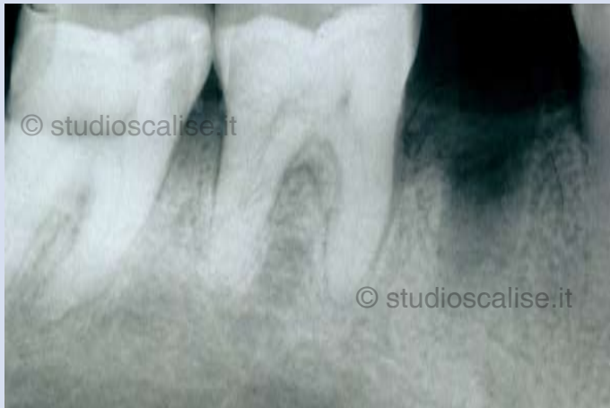
Fig. 1. Radiografia endorale eseguita dopo un mese dall'estrazione

Paziente dell'età di 45 anni, fumatrice in buona salute generale.