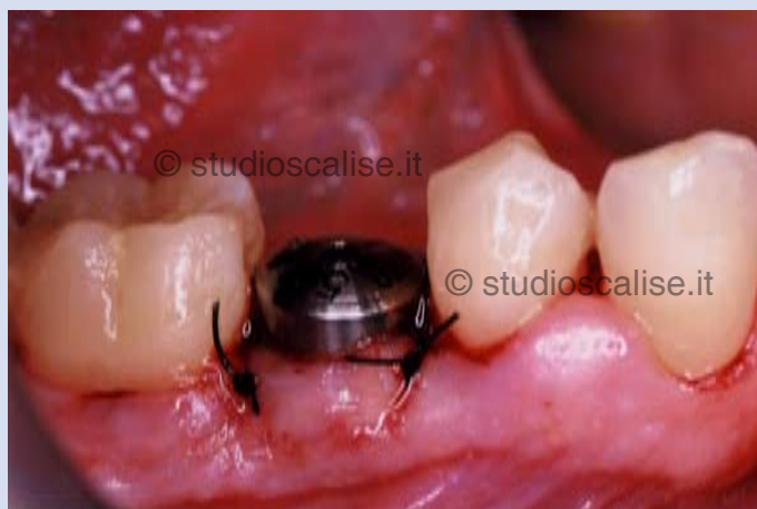
Fig. 2. Aspetto endorale dopo inserimento dell'impianto.