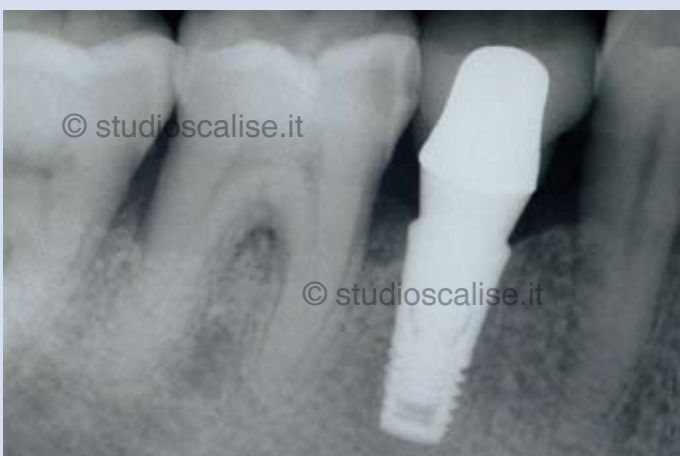
Fig. 7. Radiografia endorale dopo cementazione della corona.