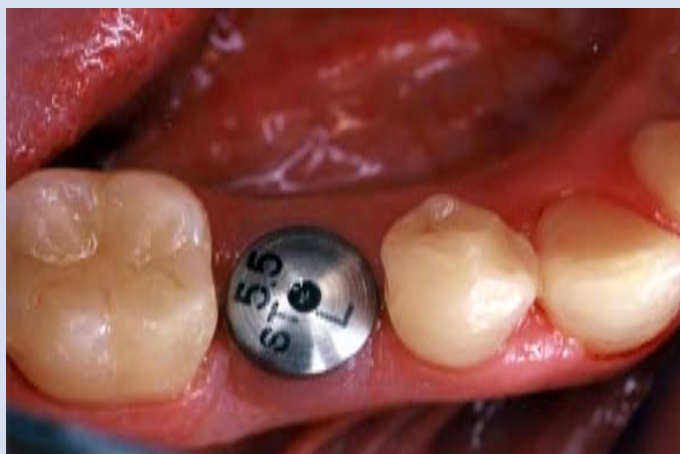
Fig. 3. Aspetto endorale dopo guarigione dei tessuti.