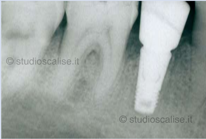
Fig. 4. Radiografia endorale dopo l'inserimento dell'impianto