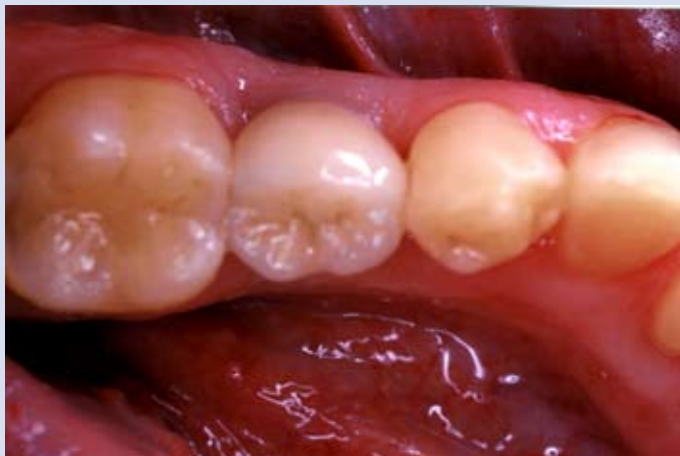
Fig.6. Corona in ceramica dopo la cementazione.