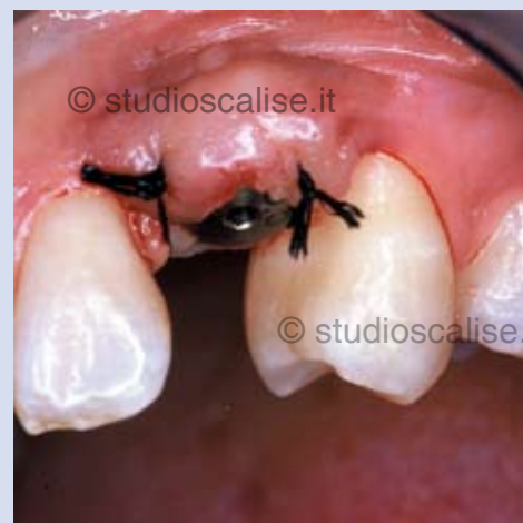
Fig. 4. Aspetto vestibolare al termine dell'intervento