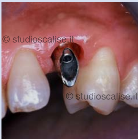
Fig. 7. Moncone in titanio avvitato sull'implianto.