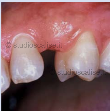
Fig. 1. Aspetto endorale che evidenzia la mancanza del canino superiore di destra

Paziente dell'età di 40 anni ,fumatrice, nessuna patologia generale.