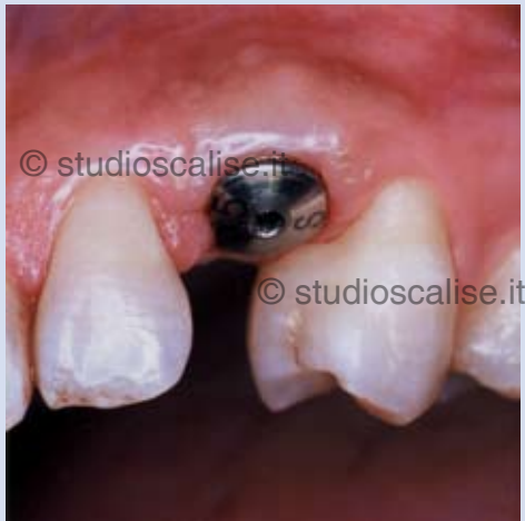
Fig. 5. Guarigione del tessuto gengivale attorno all'implianto.