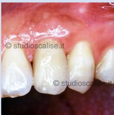
Fig. 9. Corona in ceramica su i mpianto dopo la cementazione.