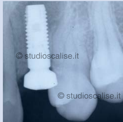
Fig. 6. Radiografia endorale dopo l'inserimento dell'implianto.