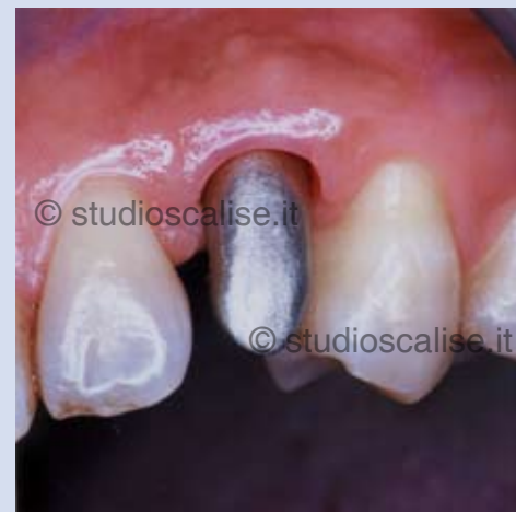
Fig.8. Prova della struttura metallica.