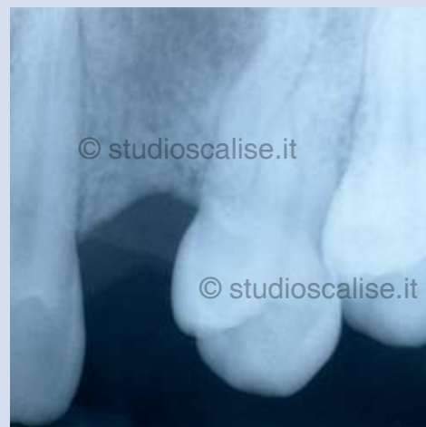
Fig.2. Radiografia endorale prima del trattamento